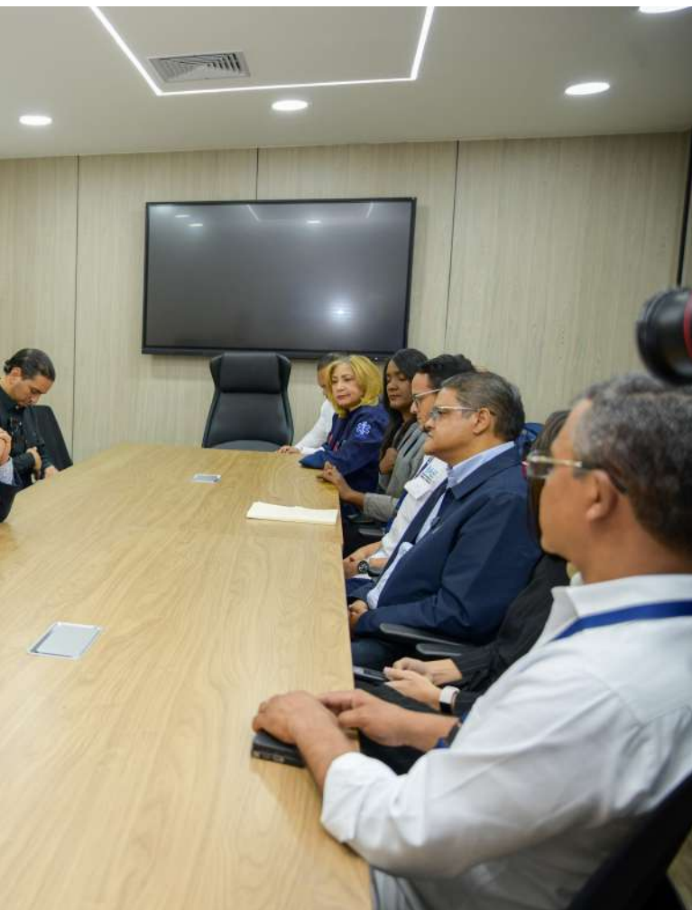
se reúnen para coordinar acciones que fortalezcan el sistema de emergencias del país.”

“Una coordinación efectiva entre la atención prehospitalaria es clave para salvar vidas y garantizar respuestas más rápidas y eficientes ante las emergencias.”