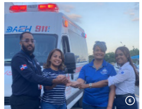
Hospital Municipal Los Llanos