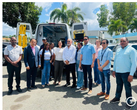
Hospital Municipal San José de las Matas