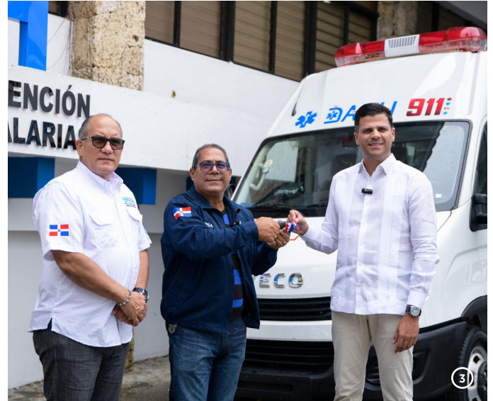
Ministerio de Interior y Policía (MIP)