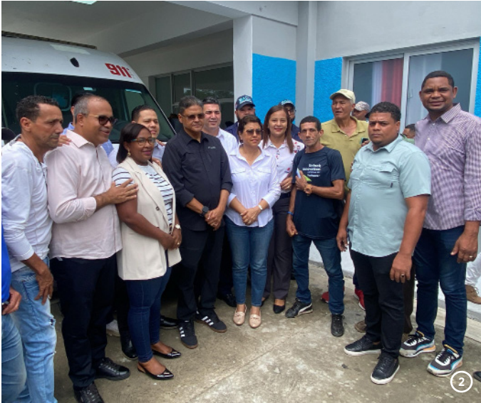
Hospital Dr. Ramón Adriano Villalona, Loma de Cabrera