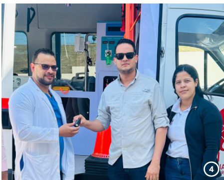
Hospital Municipal de Yamasá