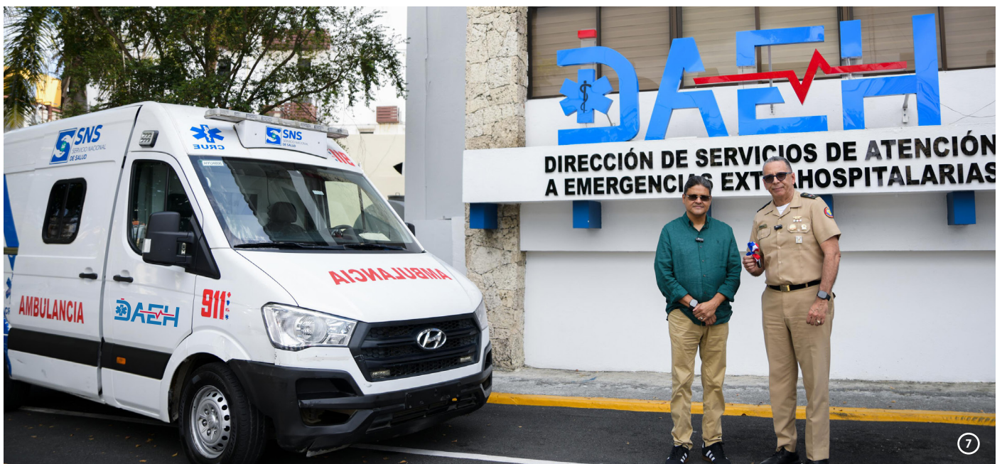
Hospital Universitario Docente Central de las Fuerzas Armadas