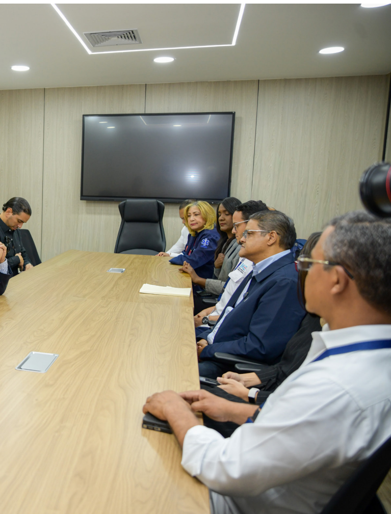
se reúnen para coordinar acciones que fortalezcan el sistema de emergencias del país.”

“Una coordinación efectiva entre la atención prehospitalaria es clave para salvar vidas y garantizar respuestas más rápidas y eficientes ante las emergencias.”